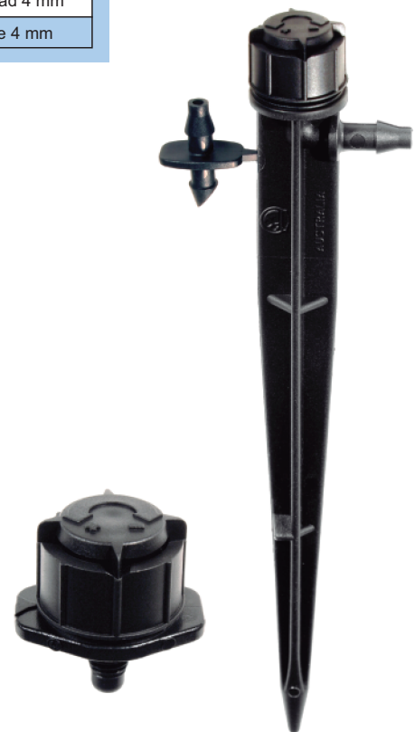
Mini Bubbler Thread